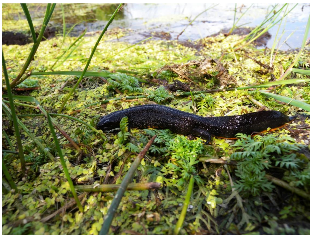
Figur 2: Stor vandsalamander, som er den eneste art på udpegningsgrundlaget for Natura 2000-området.